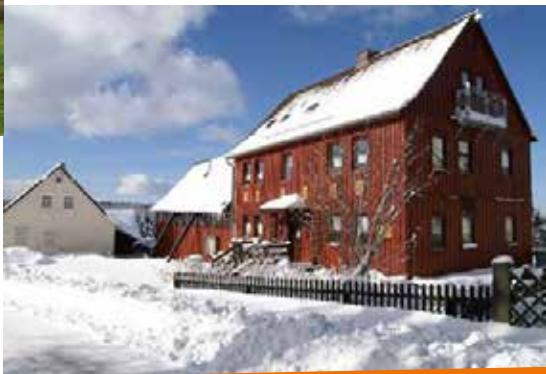
Hans-Asmussen-Haus in Dalherda