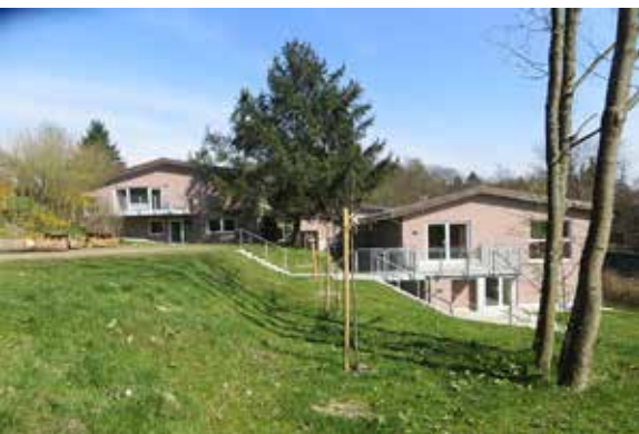
Fritz-Emmel- Haus in Kronberg

Die Auswahl der Themen und die inhaltliche Gestaltung richtet sich nach den Bedürfnissen, Fähigkeiten und Wünschen der Freiwilligen. Das heißt, Du kannst Dich aktiv einbringen und in Deiner Seminargruppe mitbestimmen. Deine Mitarbeit und Deine Ideen sind also sehr gefragt.